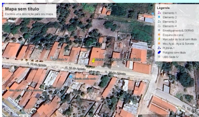
IMAGEM 1: Imagem de situação do terreno

A referida reforma será executada no prédio com sede na Rua 15 de agosto, SN, centro do município de Barroquinha-Ce, conforme coordenadas geográficas e imagem a seguir.